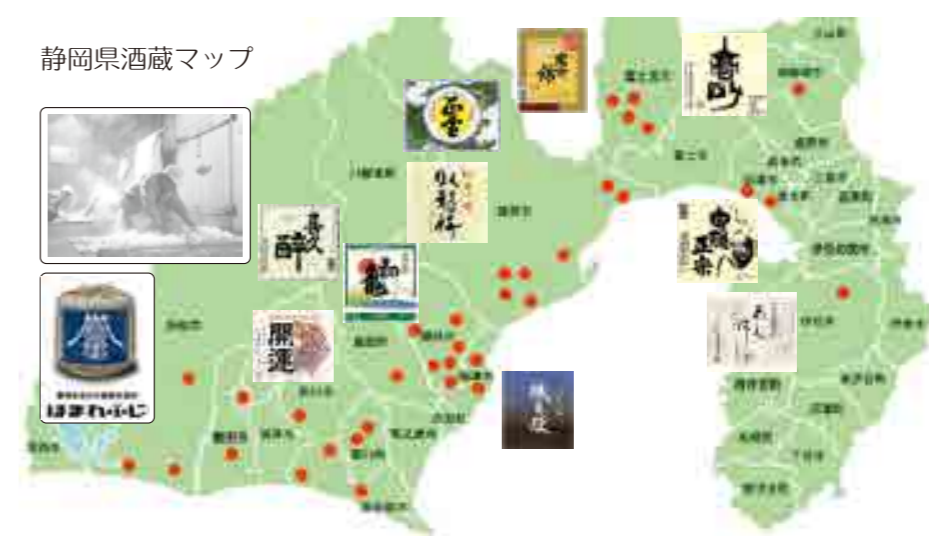
静岡県酒蔵マップ